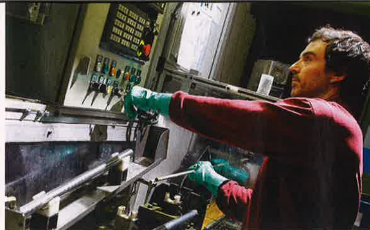
Chez Bergara, tout tourne autour des canons, dont la réputation dépasse largement les frontières espagnoles.

A.L.: Peut-être un jour, mais pour l'instant on s'assure que nos produits fonctionnent à la perfection et que nos clients sont satisfaits. Le marché des armes lisses est assez différent de celui des armes rayées. Un très grand nombre de fabricants est déjà présent sur ce marché de niche. Donc pourquoi pas dans plusieurs années, mais à l'heure actuelle, les carabines à verrou et les « kipplauf » sont notre ligne directrice.