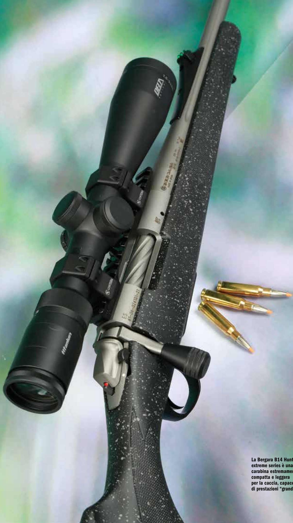
La Bergara B14 Hunter extreme series è una carabina estremamente compatta e leggera per la caccia, capace però di prestazioni "grandi".